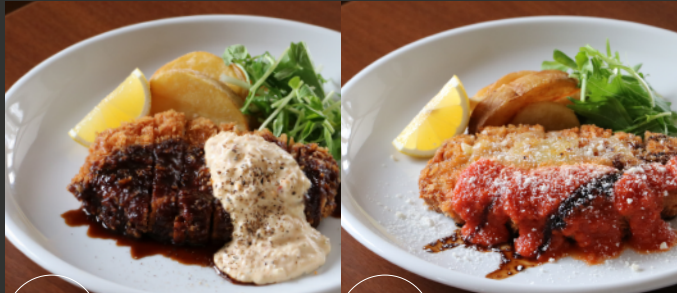
6 Pork Cutlet with Tartar Sauce 自家製和風タルタル 7 Pork Cutlet with Tomato Sauce たっぷりチーズのトマトソース