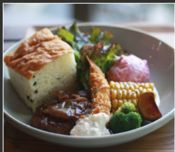
for Kids 1,250円(税込) キッズメニュー 【小学生以下限定】