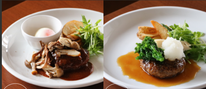
4 Demi-Glace Hamburger Steak 温玉のセデミグラスソース 5 Japanese-Style Hamburger Steak 春野菜と和風おろしソース