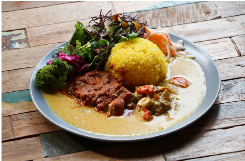
あいがけカレープレート ¥1,650 (税込)

奥伊吹の甲津原味噌を使用した優しくコクのあるホワイトソースとたくさんの具材とチーズをのせ焼いたグラタンです。