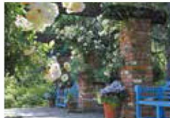
6月 レンガのパーゴラ周り