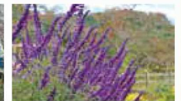
10月 メキシカンセージ