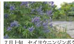
7月上旬 セイヨウニンジンボク