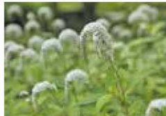
6月中旬 オカトラノオ