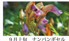
9月上旬 ナンバンギセル